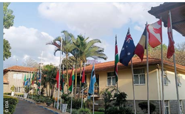
IPSTC in Nairobi, Kenya

Am Jubiläumsanlass der AMF im Oktober 2025 blickten die aktuelle Leitung sowie die ehemalige Chefin und ehemaligen Chefs auf 25 Jahre wirksamen Einsatz für Frieden und Menschenrechte zurück.