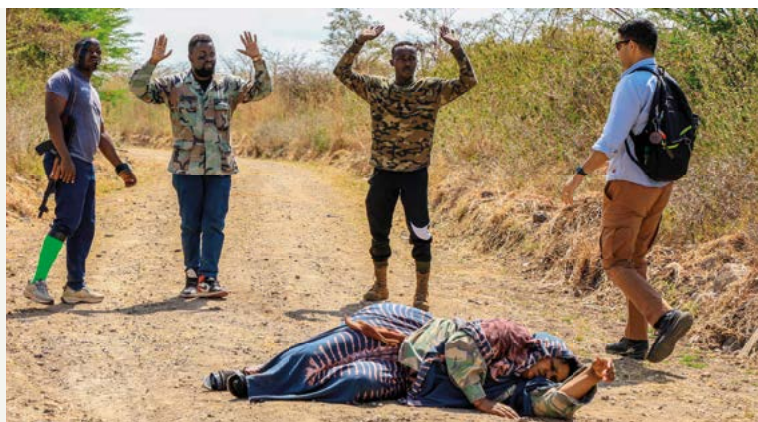
Die Schweizer Armee ist am IPSTC unter anderem für die Durchführung des Kurses SSR/DDR Level 2 verantwortlich. In praktischen Übungen trainieren die militärischen und zivilen Kursteilnehmenden verschiedene Szenarien.

Grâce à mon travail, l'Armée suisse bénéficie d'un aperçu approfondi des défis et des évolutions futurs dans les centres régionaux de formation dans le domaine de la promotion de la paix, ainsi que des développements actuels en matière de politique de sécurité en Afrique de l'Est. Je contribue en outre à la visibilité de l'engagement suisse.