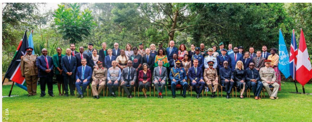
Die Teilnehmenden des UN SML-Kurses versammeln sich im Garten des Trainingszentrums IPSTC zu einem Gruppenbild (13. Februar 2025).

Par ailleurs, le PEP a promu et continue de promouvoir le développement des capacités à l'échelon international directement sur le terrain dans des centres de formation en Afrique subsaharienne, tels que l'École de maintien de la paix Alioune Blondin Beye (EMP) à Bamako (Mali), le Kofi Annan International Peacekeeping Training Centre (KAIPTC) à Accra (Ghana) et l'IPSTC déjà mentionné.