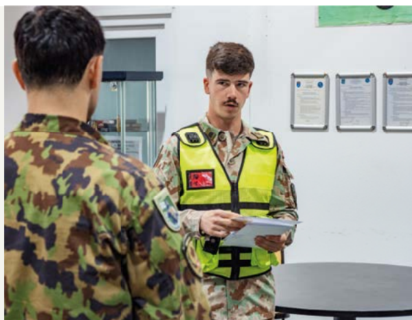
Der AirOps überprüft mit einem weiteren SWISSCOY-Angehörigen die Cargo- und Passagierliste der Flüge. L'AirOps vérifie la liste du fret et des passagers des vols avec un autre membre de la SWISSCOY.

Jobs: https://www.peacekeeping.ch/fr/domaines-dactivite