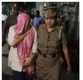
L'arrestation d'une employée locale de l'Ambassade de Suisse à Colombo