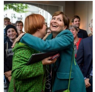
Pratiquement tous les médias ont choisi de publier des photos montrant des femmes politiques issues des partis écologistes.

espionnés. Les médias décrivent avec précision le déroulement des événements et s'interrogent sur les responsabilités et les conséquences possibles pour Credit Suisse. Le ton vis-à-vis de la banque était exclusivement négatif. Certains médias jugent en outre que ces incidents nuisent à la réputation de la place financière suisse dans son ensemble.