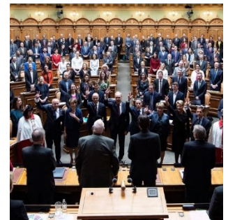
Prestation de serment du Conseil fédéral