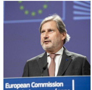
Le commissaire européen Johannes Hahn

simples sanctions (portant notamment sur l'équivalence boursière) à un isolement de la Suisse et à une détérioration de ses relations avec l'UE. La prise de position du commissaire européen Johannes Hahn en décembre fait ressortir dans la presse ces aspects et leur importance. Le contexte du Brexit est fréquemment rappelé, notamment à l'occasion d'une rencontre en octobre entre le Conseiller fédéral Ignazio Cassis et le Ministre des Affaires étrangères britannique Jeremy Hunt. Selon les médias, en effet, le dossier britannique induirait l'UE à durcir ses positions vis-à-vis de la Suisse.