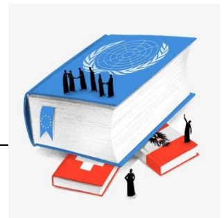
Initiative « Pour l'autodétermination »

certains titres émettent des critiques vis-à-vis des initiants qui chercheraient à entraver le droit international et l'économie. Ils se montrent mitigés par ailleurs à l'égard de la démocratie directe