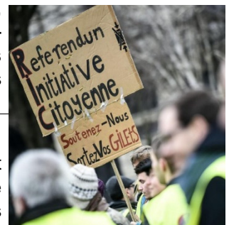
Gilets jaunes et référendum