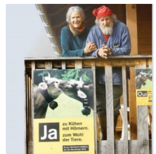
L'initiative « Pour les vaches à cornes »