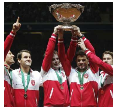
Victoire suisse en Coupe Davis