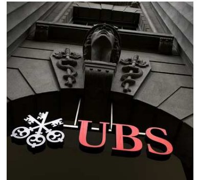
© WSJ – Manipulation des devises UBS