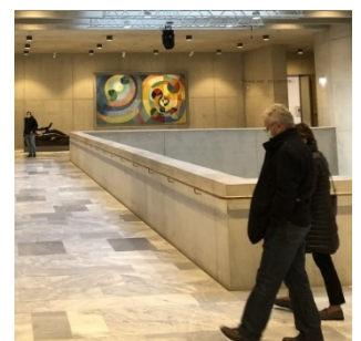
Der Erweiterungsbau des Kunsthauses Zürich mit der Bührlle-Sammlung