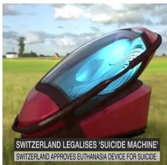
«Suizidkapsel» Sarco

Immer wieder erzielen Themen mit Bezug zur Schweiz international viel Aufmerksamkeit, obwohl ihre objektive Relevanz eher gering ist. Derartige Themen zeichnen sich oft durch eine starke Emotionalität oder durch einen hohen Überraschungseffekt aus. Im vierten Quartal 2021 stösst die Meldung über eine angeblich rechtliche Zulassung der sogenannten 'Suizidkapsel Sarco' in der Schweiz auf grosses Interesse. Medien weltweit berichten