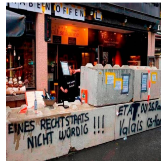
Die Schliessung eines Zermatter Restaurants wegen Verstössen gegen die Schutzmassnahmen ist auch Thema in ausländischen Medien