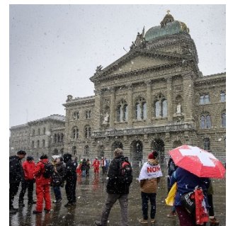
Auch die Abstimmung zum Covid-19-Gesetz wird als polarisiert wahrgenommen