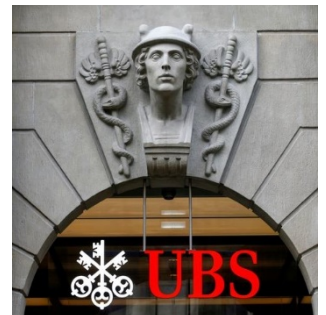
Berichterstattung zu Schweizer Grossbanken wird meist mit Symbolbildern illustriert