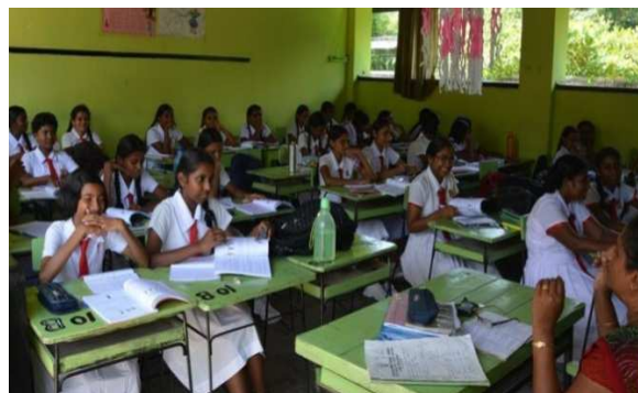
Filles bénéficiant d'un enseignement scolaire dans l'une des écoles reconstruites à Sumangala (district de Matara).

En collaboration avec le Ministère de l'éducation sri-lankais, la DDC a ensuite entamé dans cette même région un programme de reconstruction d'écoles à vocation durable.