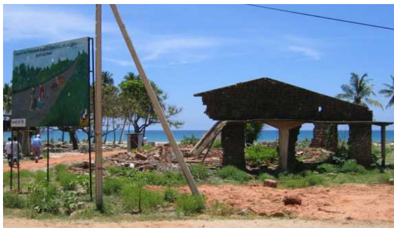
Le village de Kinniya, dans le district de Trincomalee, a été frappé de plein fouet par le tsunami de 2004. De nombreuses maisons furent réduites à néant.