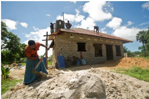
Les familles ont pu reconstruire leurs maisons comme elles le souhaitent.

Les autorités sri-lankaises lancèrent un programme de reconstruction intitulé «Cash for Rehabilitation and reconstruction». Le programme avait la particularité d'impliquer directement les bénéficiaires : les familles à reloger recevraient une aide financière qui leur permettaient de réparer et reconstruire elles-mêmes leurs maisons en fonction de leurs besoins spécifiques.