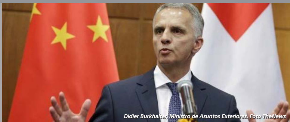
Didier Burkhalter, Ministro de Asuntos Exteriores.

Con base en artículo de 23.05.2016 Marc Lettau, Panorama Suizo