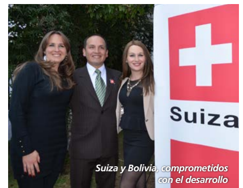
Suiza y Bolivia, comprometidos con el desarrollo

Discurso en: https://youtu.be/4b8d2DdyeNg