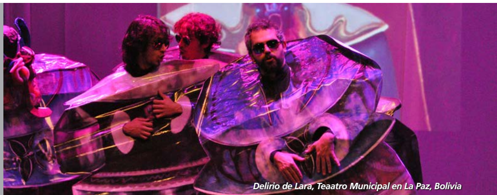
Delirio de Lara, Teatro Municipal en La Paz, Bolivia