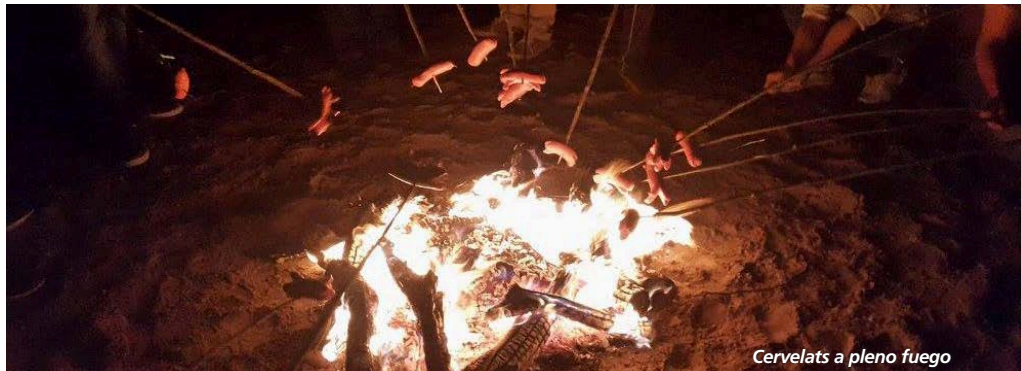
Cervelats a pleno fuego