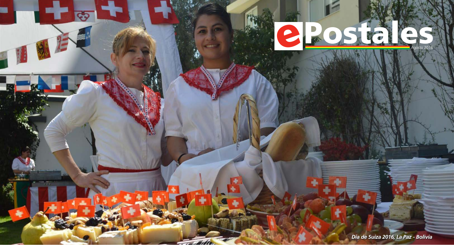
Día de Suiza 2016, La Paz - Bolivia