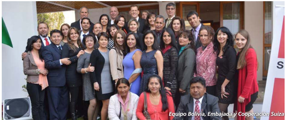
Equipo Bolivia, Embajada y Cooperación Suiza

en Bolivia así como miembros de la comunidad internacional, medios de comunicación y otros sectores importantes del ámbito nacional.