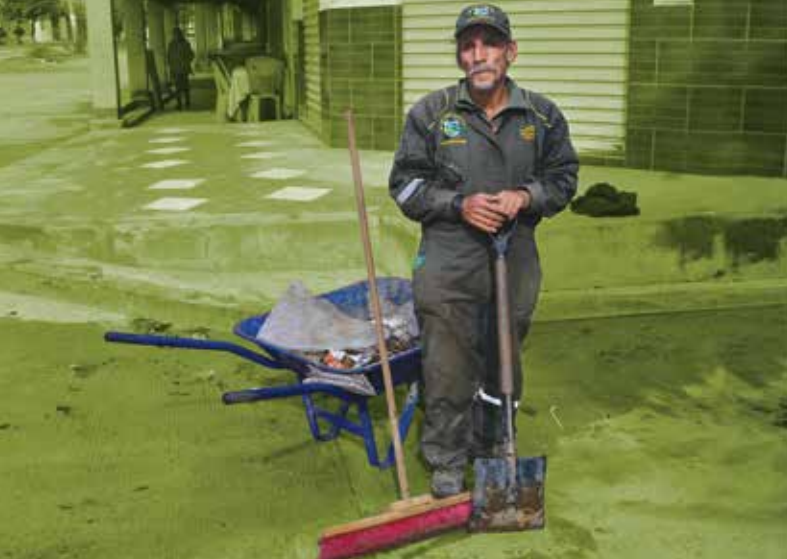
Limpieza de las calles en Monteagudo.