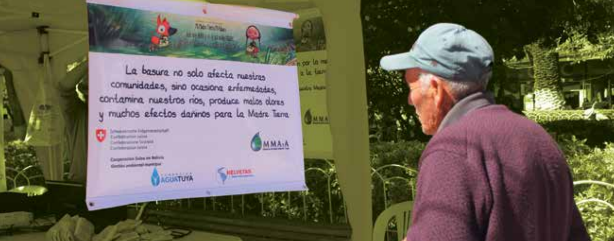
Campaña de la Madre Tierra en Punata.