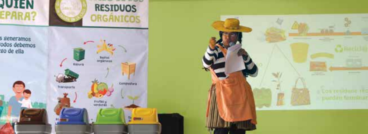
Dinámicas eco-juveniles a unidades educativas de Tolata.