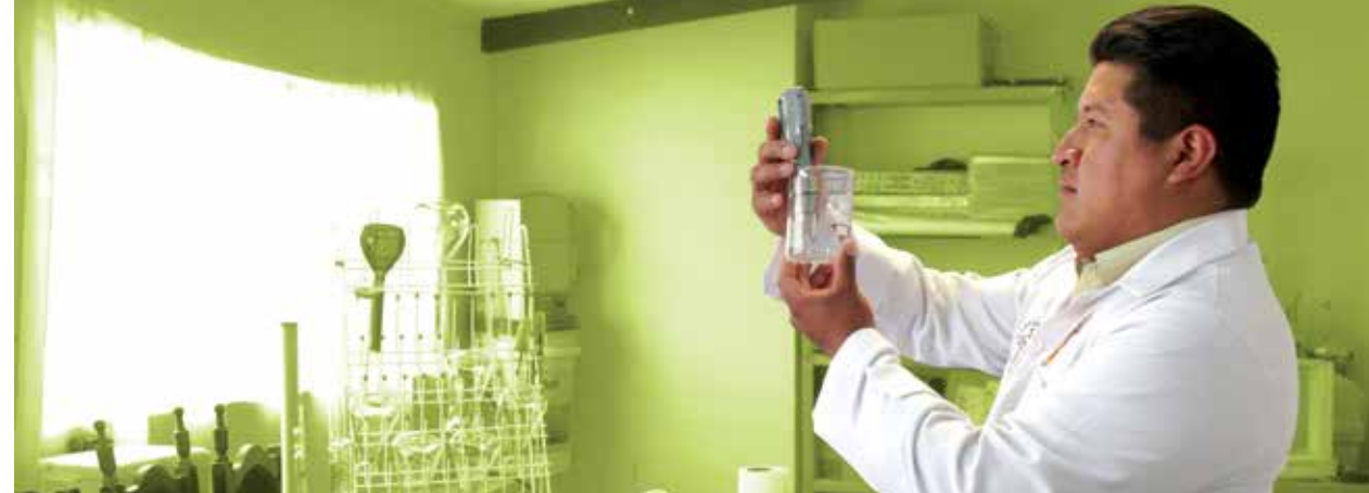
Laboratorio de la planta de tratamiento de aguas residuales en Villazón.