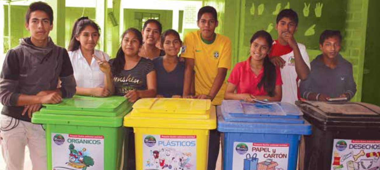
Estudiantes capacitados en reciclaje y selección de residuos sólidos.