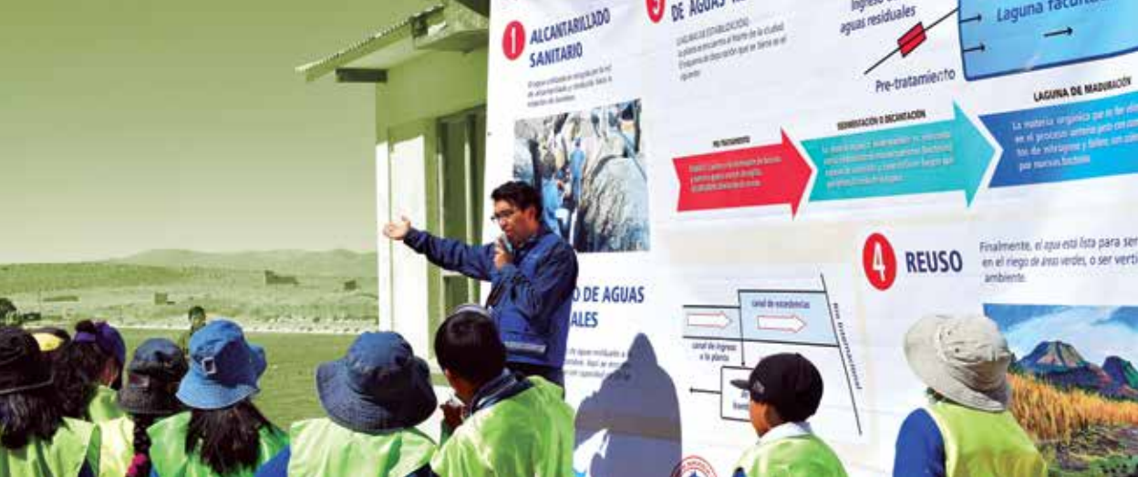
Tour ambiental de niños de primaria en la planta de tratamiento de agua en Villazón.