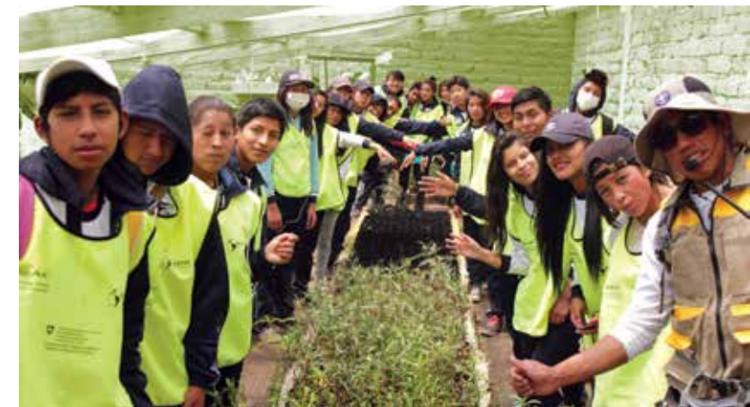
Visita de jóvenes al vivero municipal de Villazón.

Debido a la importancia del tema, se aprobó una nueva fase del proyecto planificada para abril 2019 hasta marzo del 2023.