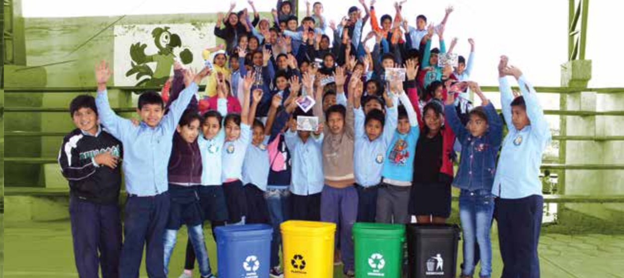
Niños capacitados en selección y reciclaje de basura en el Chaco.