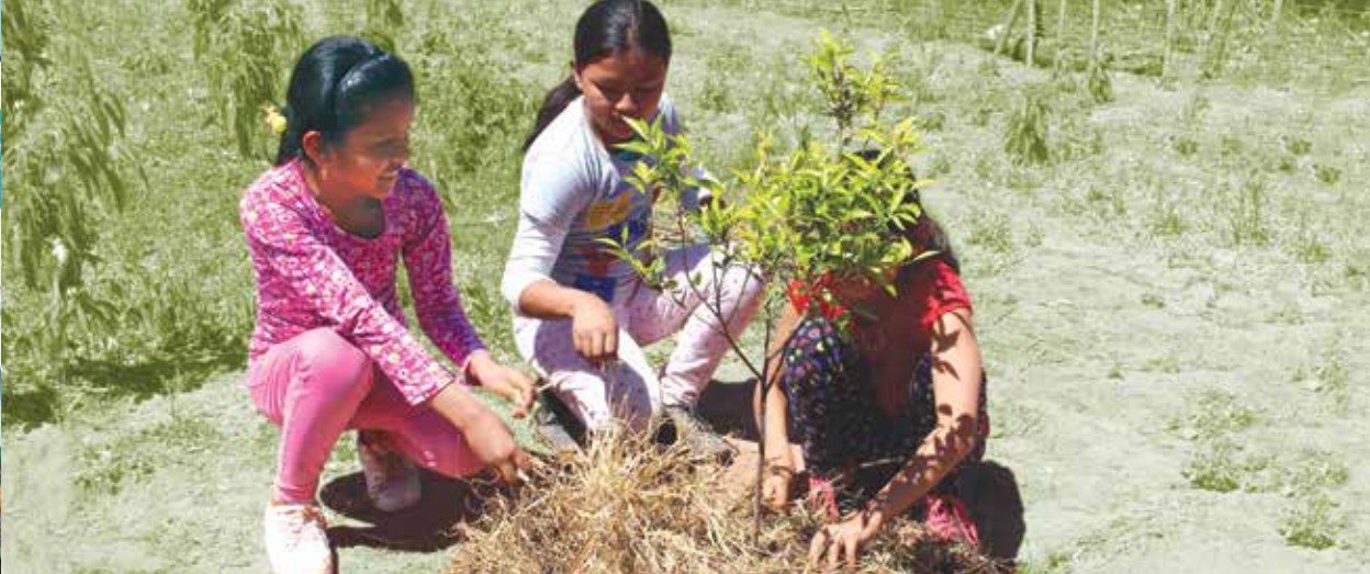
Niñas utilizan compostaje en actividades de reforestación en Villamontes.