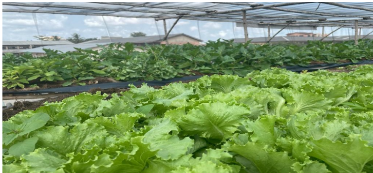
Agriculture hors sol biologique de jeunes maraichers soutenus par la Suisse au Bénin.

La Suisse accompagne la transformation de l'économie béninoise vers une économie plus productive et créatrice de valeur ajoutée. Elle met l'accent sur le secteur agricole et la promotion de l'entrepreneuriat, la création d'emplois et de revenus pour les populations, en particulier pour les jeunes et les femmes.