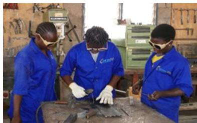
Apprenantes en Soudure au Centre Liweitari, Natitingou, © Coopération suisse au Bénin