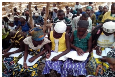
Centre d'Alphabétisation du PAGEDA à Kandi