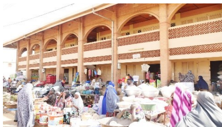
Boutiques étages au marché de Malanville construites en matériaux locaux par PIEM