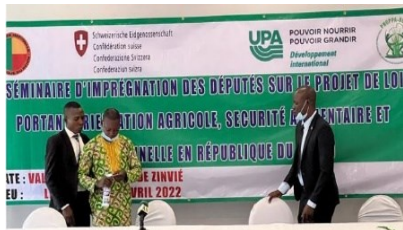
Séminaire d'imprégnation des députés sur la Loi d'Orientation Agricole et de Sécurité Alimentaire et Nutritionnelle (LOASAN).