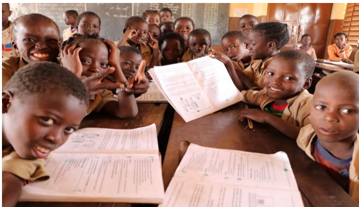
Une classe d'intervention du Programme d'Appui à la Qualité de l'Éducation (PAQUE).

Enveloppe budgétaire du programme de coopération suisse Bénin 2022-2025 allouée à l'Éducation de base et formation professionnelle