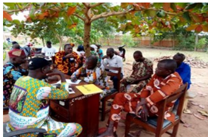
Groupe de travail d'acteurs communaux lors de l'élaboration du Schéma Directeur d'aménagement communal