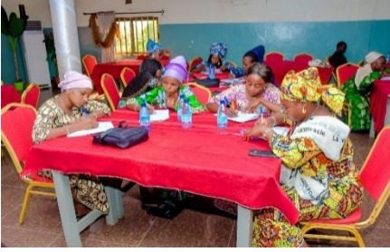
Formation des jeunes femmes au Leadership féminin et à l'Engagement politique par le PAEG -phase 1