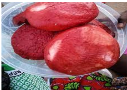
Fromage wagashi produit par les femmes du PASDeR