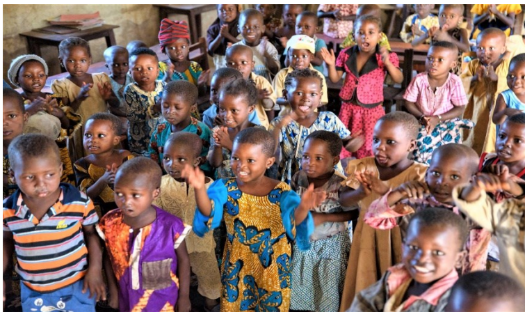
La jeunesse est un enjeu pour la Coopération suisse au Bénin. Photo de famille de l'Ecole maternelle de Tchachou dans le Borgou.

Taux de croissance démographique au Bénin