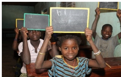
Les filles des centres Barka du PAEFE