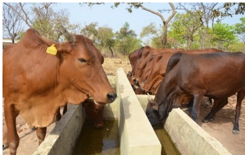
Abreuvoir construit par la Suisse dans le domaine du DERL.