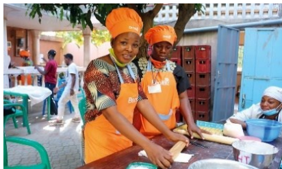
Formation en pâtisserie par les jeunes entrepreneurs du projet BeniBiz