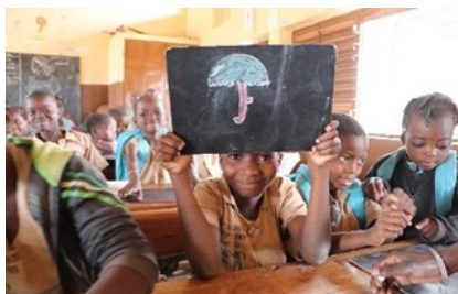
Une classe d'intervention du PAQUE