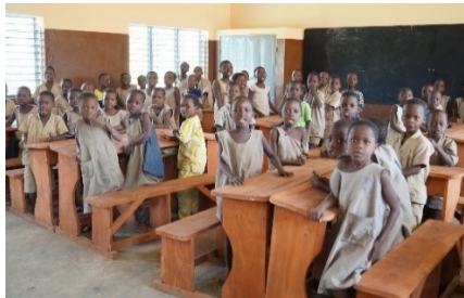
Dotation d'écoles en mobiliers scolaires sur fonds FADeC