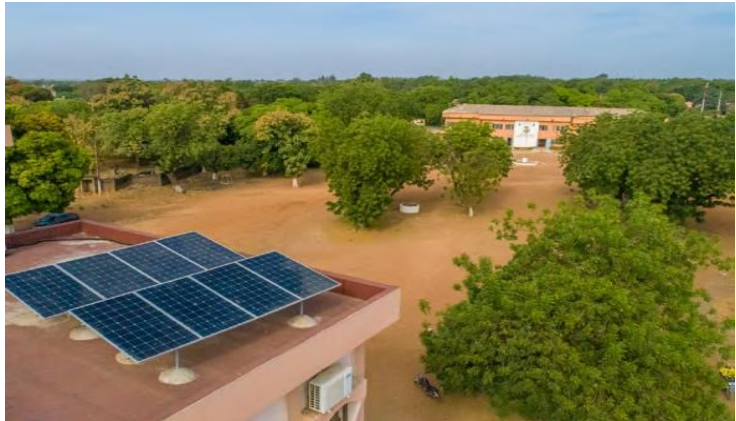
Panneaux solaires installés à la mairie de Kandji par le programme d'Appui au Secteur de la Gouvernance Locale (ASGoL) auquel succède le programme Appui à la Gouvernance locale et au Renforcement de l'Attractivité territoriale (AGORA).

4 Référentiels sont produits pour l'évaluation de la qualité des services essentiels dans le cadre des interpellations citoyennes.